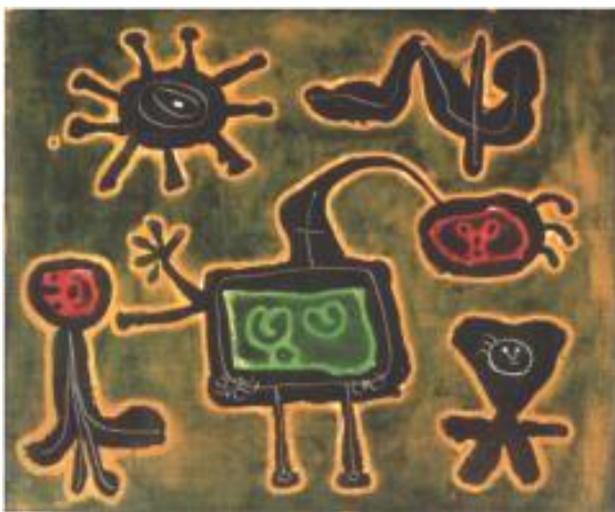
Joan Miro- Series I, 1952-1953

Αποφασίστηκε να δουλέψουμε και με τα δυο έργα.