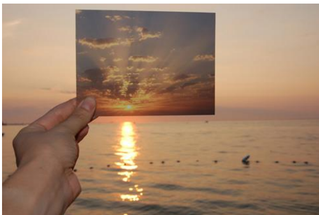
The Sun is Always Setting Somewhere Else, Lisa Oppenheim, 2006